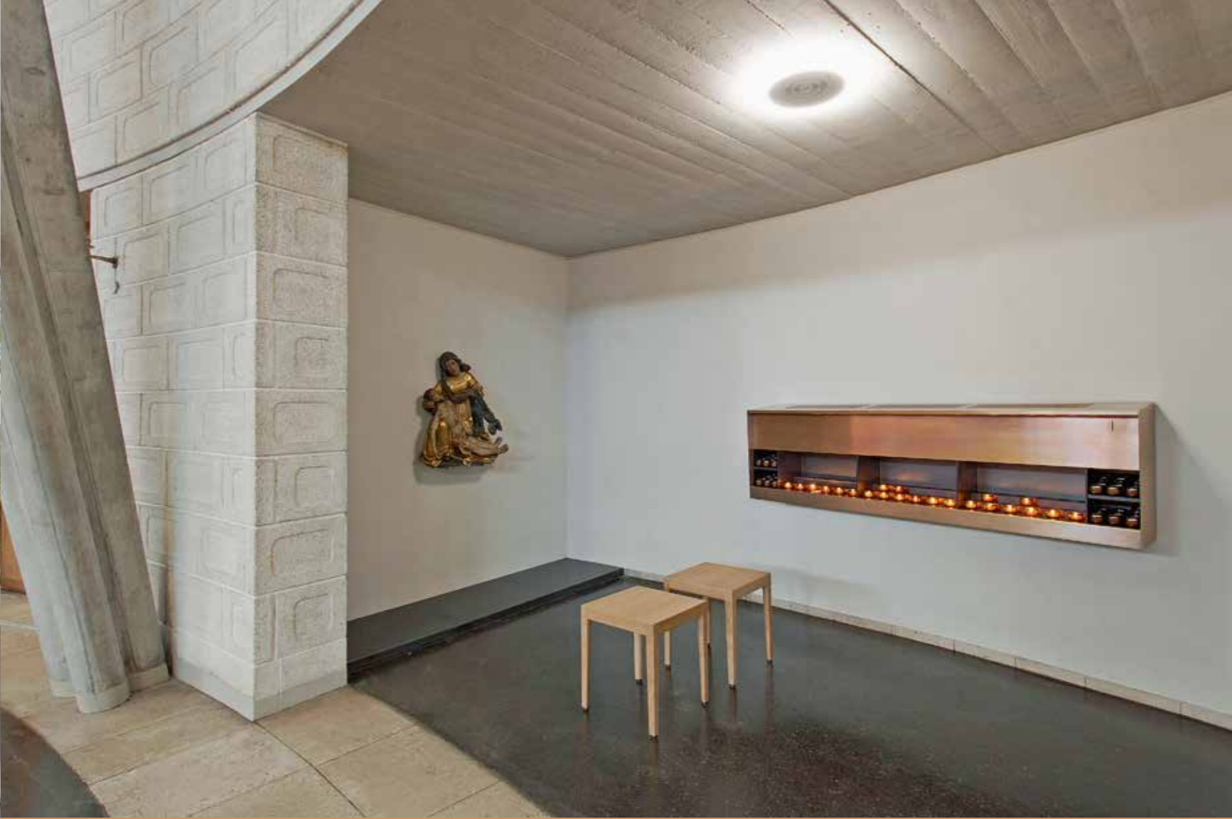
From left to right, from above to below: Typical elements in nave, church building and forecourt, prayer room in chapel. Right: Room in side aisle.